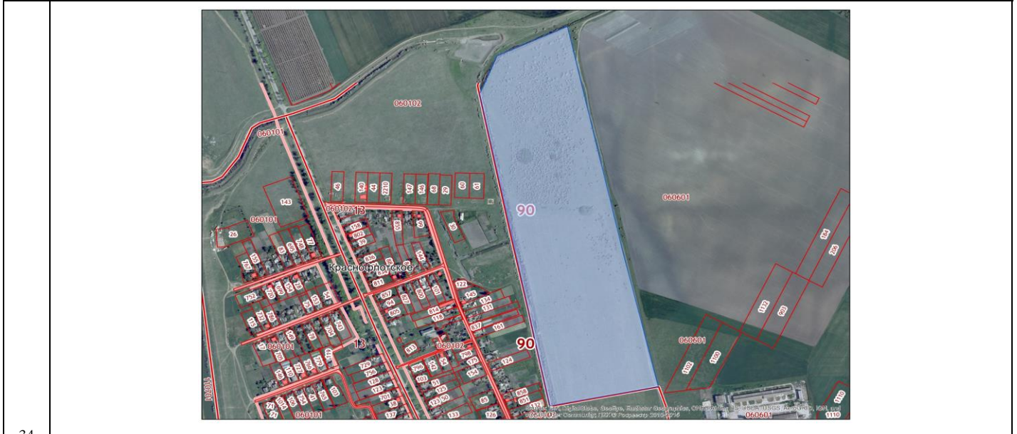
Схема расположения земельного участка на публичной кадастровой карте РФ