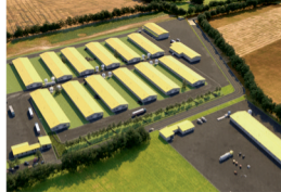
ПТИЦЕВОДЧЕСКИЙ КОМПЛЕКС ПО ВЫРАЩИВАНИЮ ИНДЮШАТ НА МЯСО (1,5 тыс. тонн мяса в год)