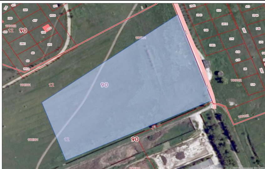
Схема расположения земельного участка на публичной кадастровой карте РФ