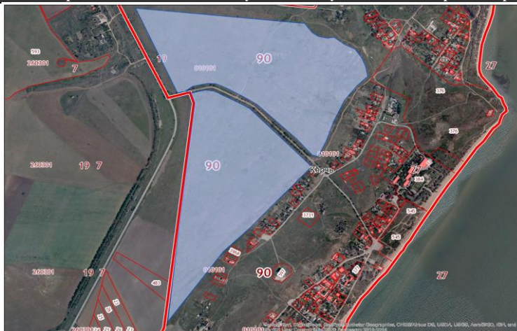
Схема расположения земельного участка на публичной кадастровой карте РФ